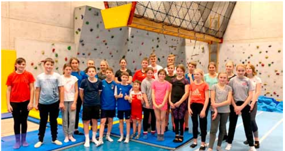
Die Schwimmer/-innen in der LOOP-Bewegungslandschaft.