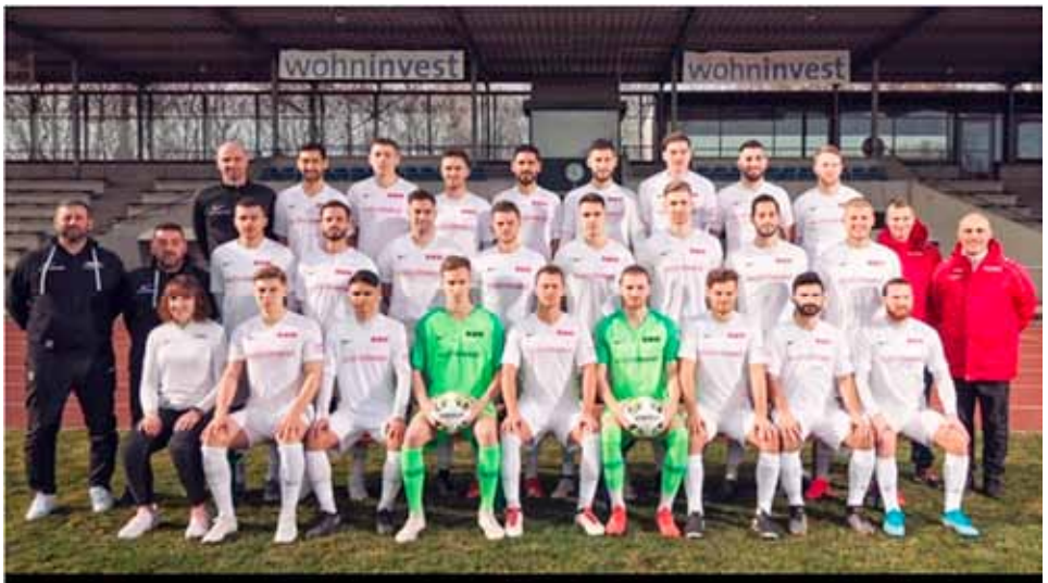
So präsentiert sich der Verbandsligakader für die restliche Saison.