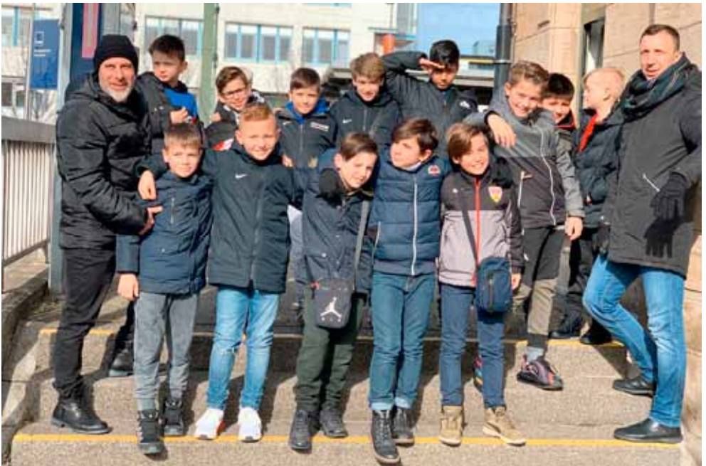
Ausflug nach Großaspach.

Die Rückrunde werden wir als F1-Mannschaft bestreiten und starten mit dem großen Leistungsvergleich in Linz/ Österreich Anfang März.