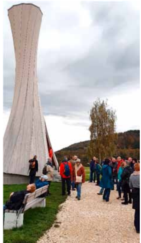
Am Urbacher Turm.