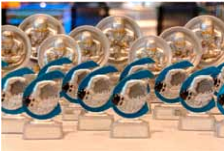
Die Siegerpokale beim Moikäfer Cup.

Weitere Infos und Veranstaltungen finden Sie auf unserer Homepage www.fellbachschwimmen.de