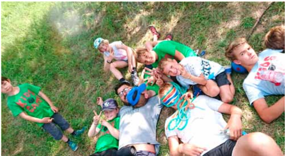
KiSS-Camp macht Spaß !