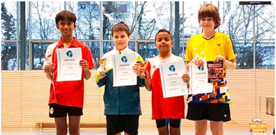
Erfolgreiche Fellbacher Nachwuchs-Doppelspieler.